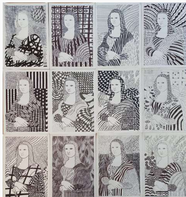
Trabalhos realizados pelos alunos do 7.ºA e 7.ºB em sala de aula