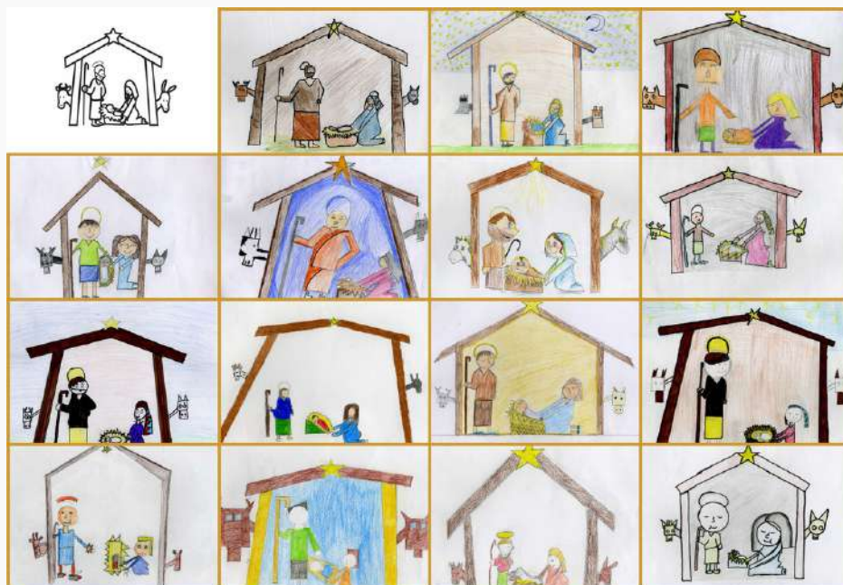
Trabalhos realizados pelos alunos do 6.º B em sala de aula

José Vicente - docente de Educação Visual