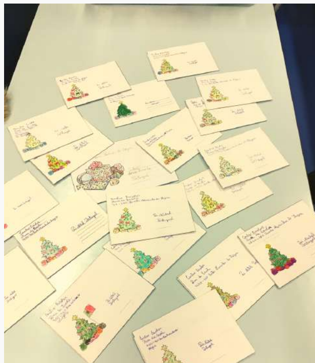
Alunos do 3.ºA