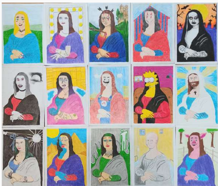
Trabalhos realizados pelos alunos do 8.º A em sala de aula