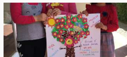
JI do Barroncal