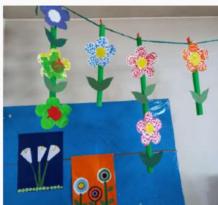
JI da Teixeira

Na primavera, o campo torna-se um misto de cores, onde as crianças brincam e o mundo sorri, porque a primavera cheira a flores e sabe... a recreio, sem dúvida!