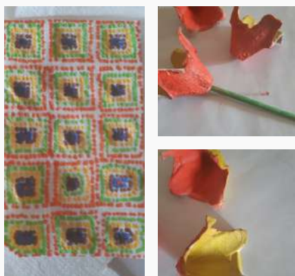
JI de Viariz