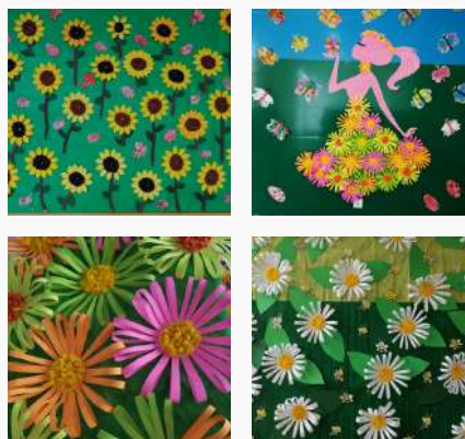
JI do Sudeste