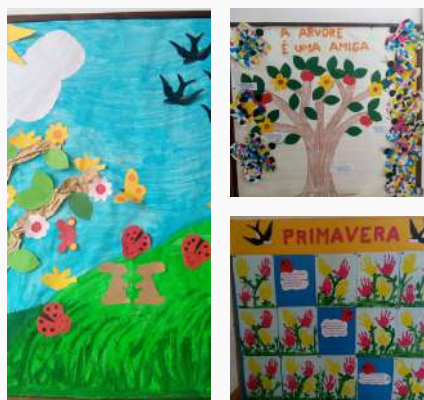
JI de Senhora