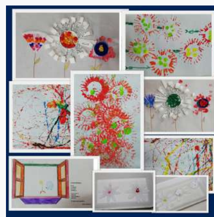
JI de Carvalhais