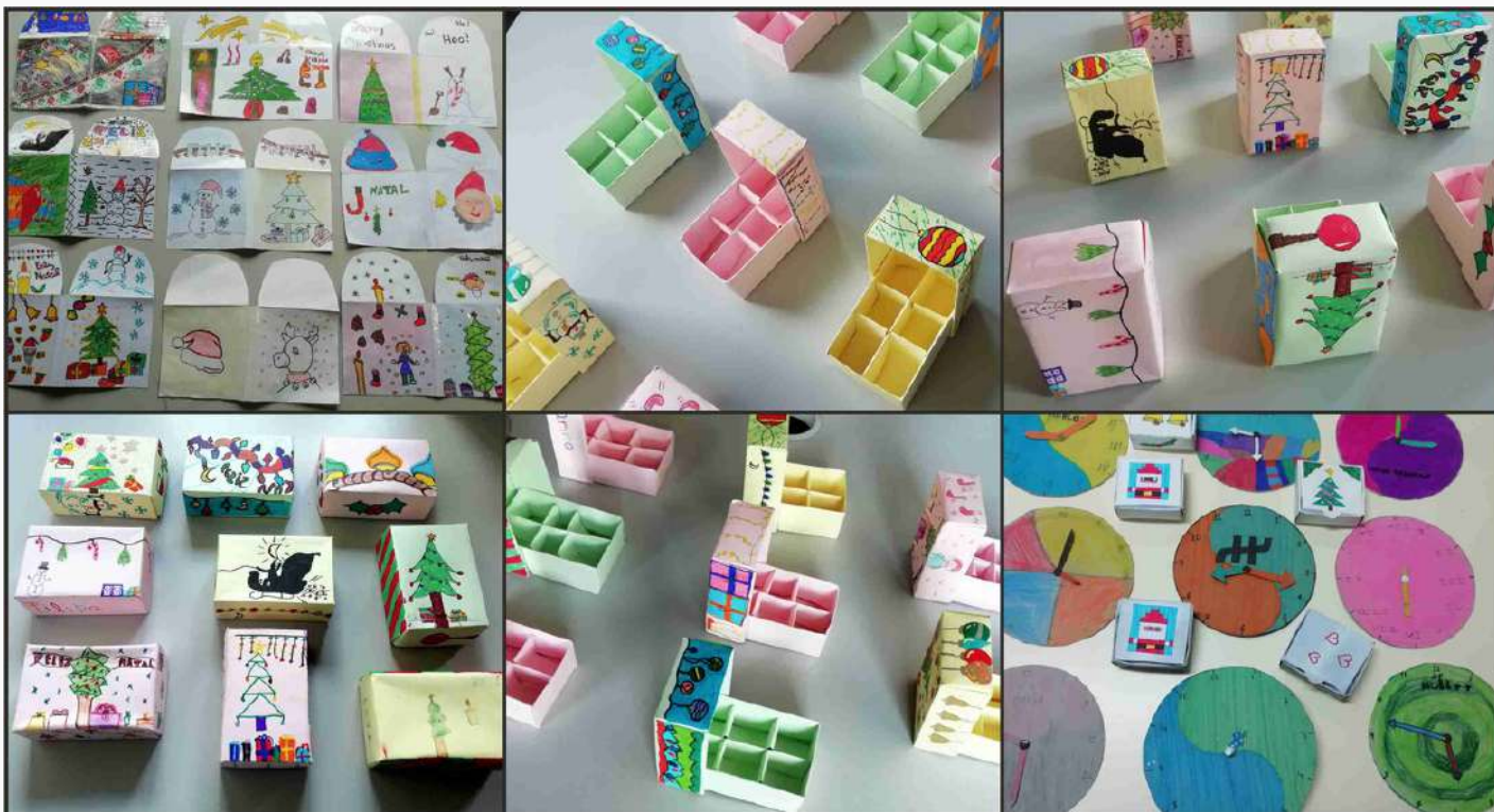
Trabalhos realizados pelos alunos dos - 5A, 6A, 6B, 6C na aula de Educação Tecnológica

Aníbal Peres- docente de Educação Visual e Educação Tecnológica