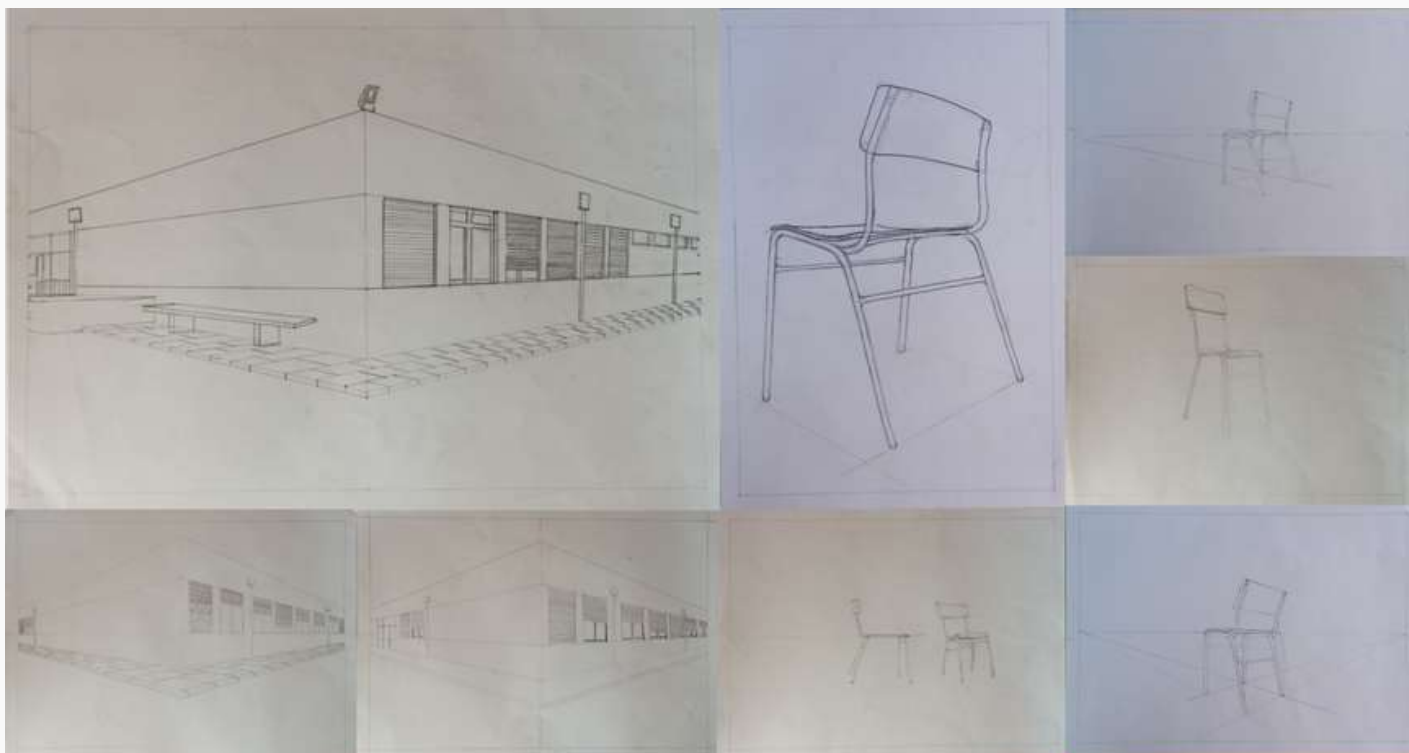
Trabalhos realizados pelos alunos do 9.º A em sala de aula

Armando Ribeiro - docente de Educação Visual